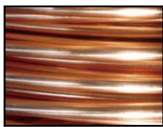
Durch mechanisches Schälen behandelter Kupferdraht

Bei normalen Kupferdrähten werden Verunreinigungen, die während der Bearbeitung entstehen, durch eine Säurebehandlung (pickeling/Beizen), entfernt. Für Oyaide's 102 SSC wird ein sehr aufwändiges mechanisches Verfahren eingesetzt. Die Oberfläche des Drahtes wird durch einen präzisen kontrollierten Prozess mechanisch abgeschält. Dieses peeling entfernt 100 % aller Verunreinigungen.