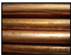
Normal gezogenener Kupferdraht